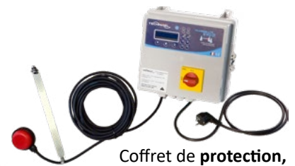
Coffret de protection, d'alarmes et de gestion