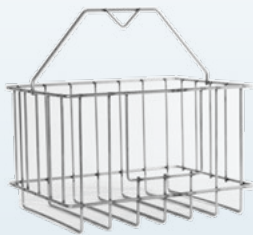
Panier de dégrillage en option