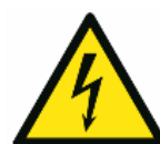
Avertissement contre la tension électrique