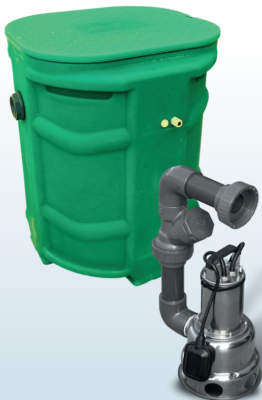
SANIREL 250 KIT DE CONNEXION