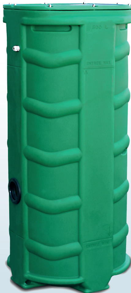
SANIREL 500V KIT DE CONNEXION