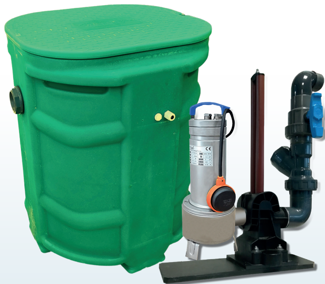
SANIREL 250 1 POMPE BARRES DE GUIDAGE