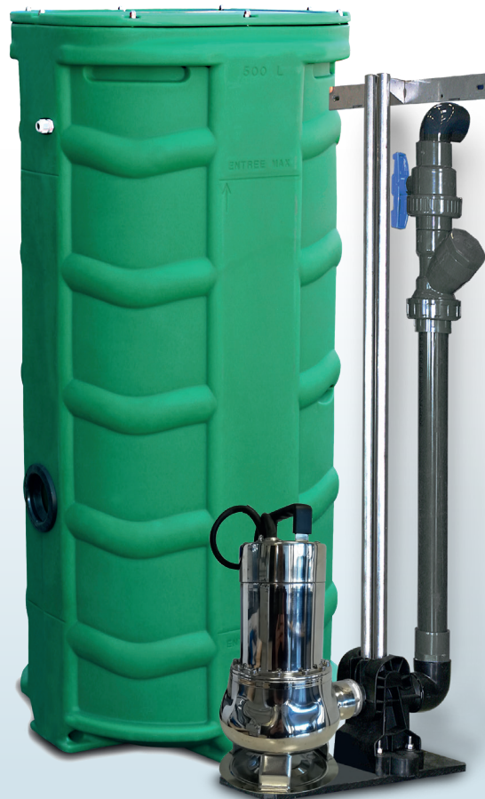
SANIREL 500V 1 POMPE BARRES DE GUIDAGE