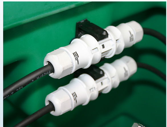
Connecteur étanche IP68 M/F 3 pôles monté dans la station : Réf : 001163