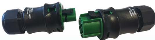
Connecteur étanche IP68 M/F 3 pôles Réf : 000492