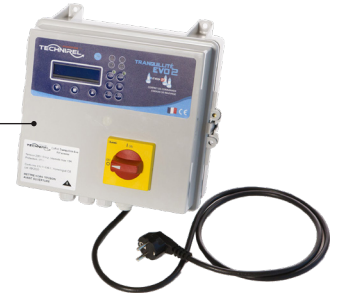
Coffret de protection, d'alarmes et de gestion