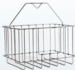
Panier de dégrillage en option