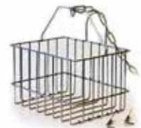
Panier de dégrillage (option)