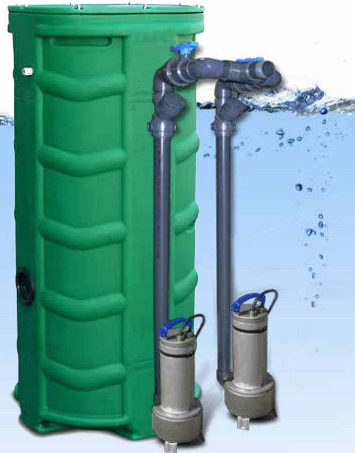
SANIREL 500V 2 POMPES VERSION KIT CONNEXION