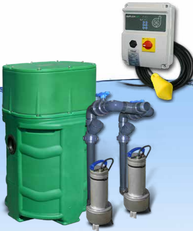
SANIREL 250 2 POMPES VERSION KIT CONNEXION