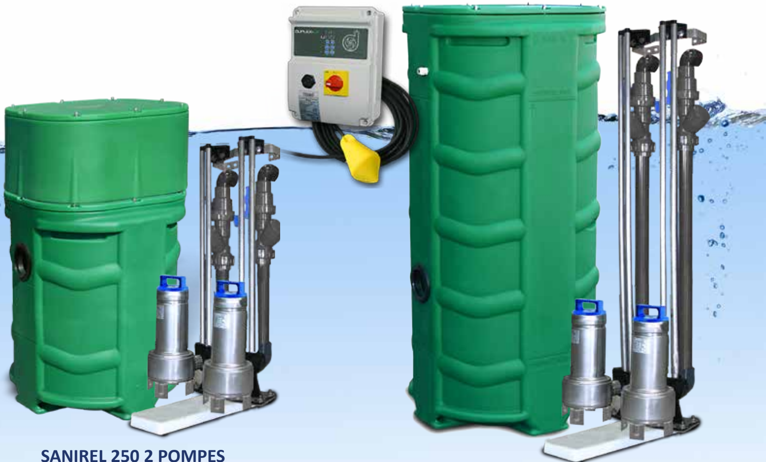
SANIREL 250 2 POMPES VERSION BARRES DE GUIDAGE