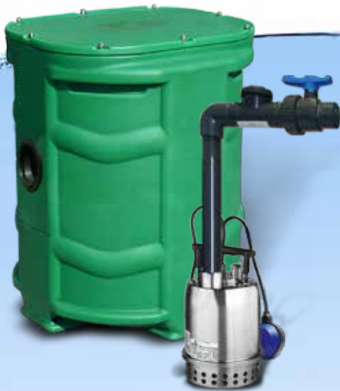
SANIDRAIN 250 VERSION KIT DE CONNEXION