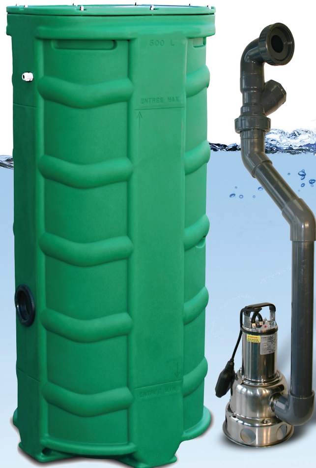
SANIREL 500V VERSION KIT DE CONNEXION