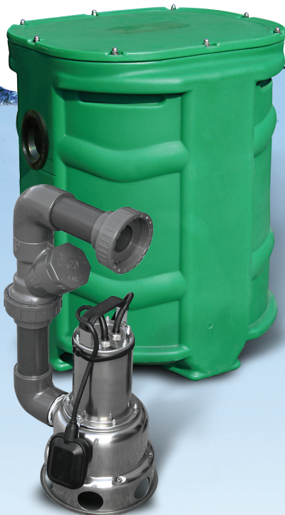
SANIREL 250 VERSION KIT DE CONNEXION